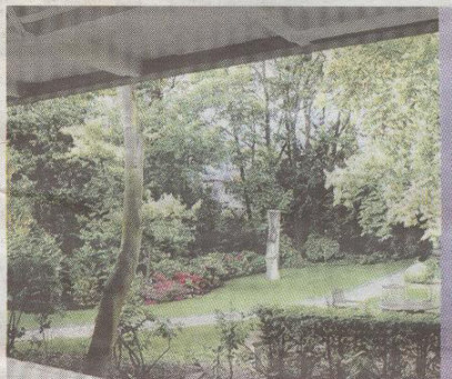
Een oude donkere garage werd een licht en luchtig woonhuis.

glazen pui die zicht biedt op het park, middenin het pand werd een 'zwevende doos' gehangen met drie slaapkamers en twee badkamers. In de doorschijnende wand is led-verlichting verwerkt. „Dat geeft vooral 's avonds veel sfeer,” zegt Doepel. Onder de slaaperdieping werd een betonnen bak gemaakt waarin twee afgesloten opslagruimten en een verdiepte keuken werd gemaakt.